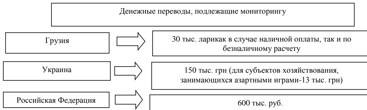
Рис. 1. Денежные переводы, проводимые в Грузии, Украине и РФ, которые подлежат государственному финансовому мониторингу

Законами этих государств определены финансовые операции, которые подлежат финансовому мониторингу, в том числе и денежные переводы (рис. 1).